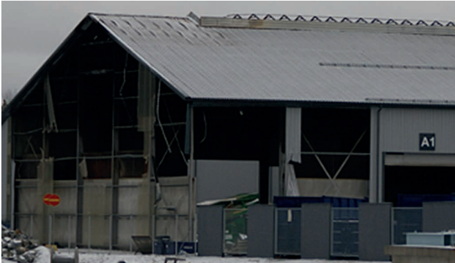
Teräsrakenteiden vaurioita, varastohallin väliseinä.