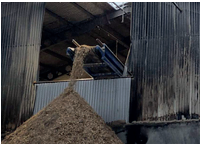
Betonielementeissä ei havaittu palon aiheuttamia vaurioita.