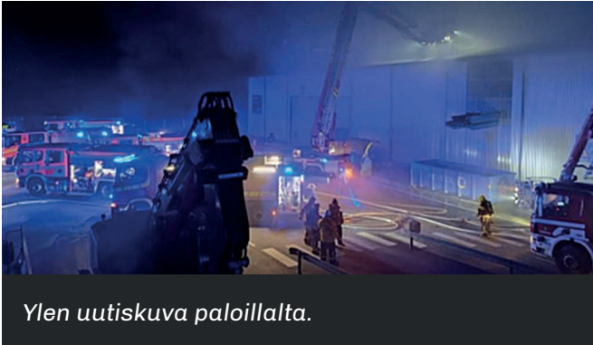
Ylen uutiskuva paloillalta.

"Vesikatto- ja peltiverhous vaurioitunut varastohallin osalta kokonaan ja murskasuhallin osalta A3 oviaukolle asti. Nosto-ovet vaurioituneet palossa, osa nosto-ovista poistettu/tippunut palon yhteydessä, jäljellä olevin nosto-ovien kiinnitysvaijerit katossa ovat altistuneet tulipalossa kovalle kuumuudelle, jonka takia näiden kestävyys on vaarantunut. Hallissa olevissa paloposteissa on nähtävissä palon aiheuttamia värinmuutoksia. Varastohallin puolella myös kattovalaistus tuhoutunut."