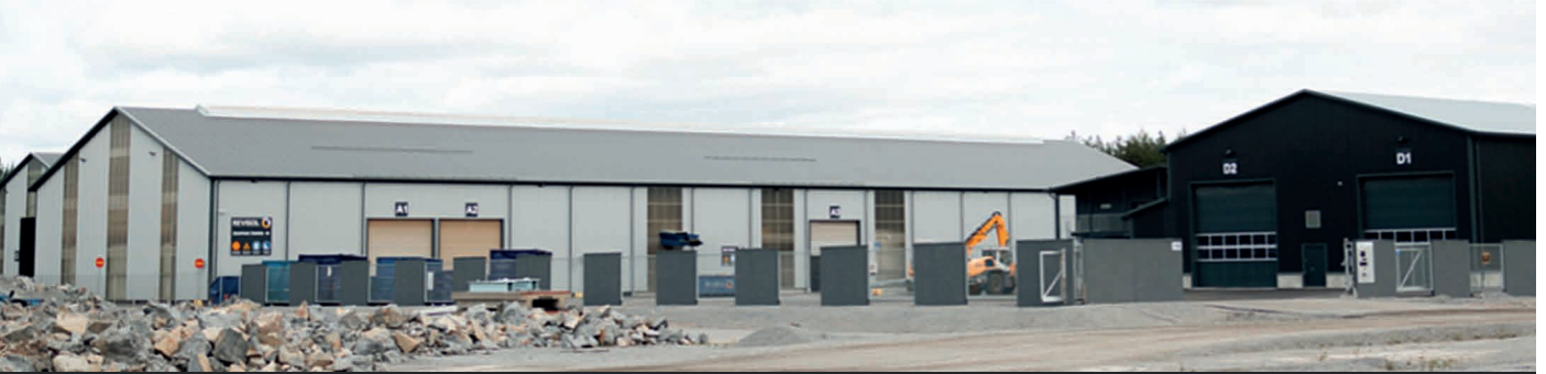
Tulipalo syttyi kuvassa olevassa vaaleanharmaassa rakennuksessa.

Saimme uutisoinneista kuulla illalla 12.11.2022, että asiakkaamme jätteenkäsittelylaitoksella Nokiolla on alkanut tulipalo. Samalla kiinteistöllä 4 kpl Conexx®-rakennusta.