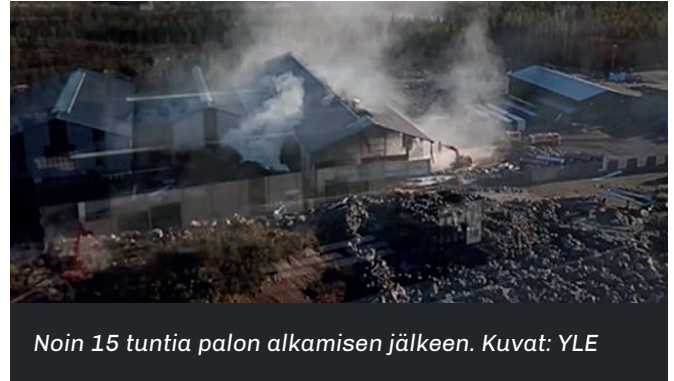
Noin 15 tuntia palon alkamisen jälkeen.